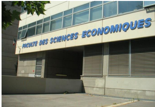
Vue Coté av R. Dugrand

Faculté d'Economie Av. Raymond Dugrand Campus Richter Bâtiment C Montpellier plan accès http://www.umontpellier.fr/universite/composantes/facultes/ufr-deconomie/