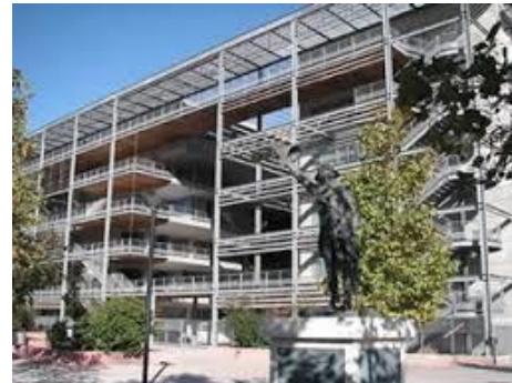
Vue coté Campus